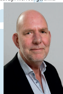
R. Monen - Oostzaan Natuurlijk

Groen: in de begroting is veel te weinig aandacht voor o.a. klimaatadaptatie en biodiversiteit. Dit moet aangescherpt om Oostzaan ook in de toekomst leefbaar te houden. Meer bomen kunnen de temperatuur dragelijker houden.